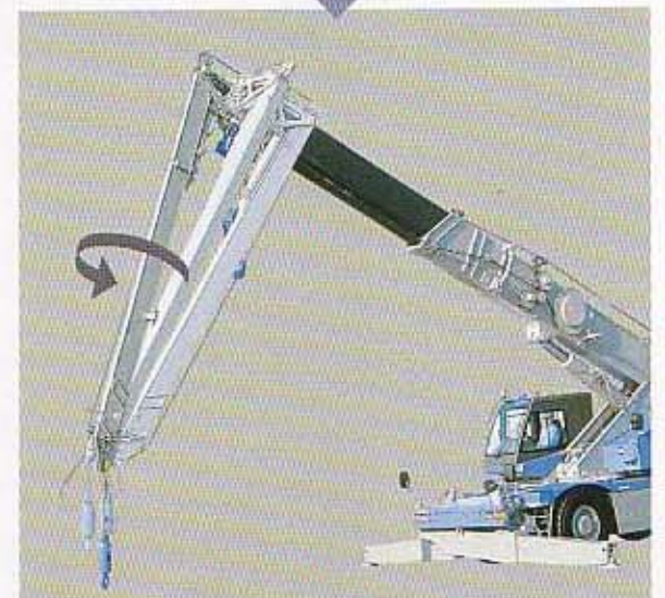
▲ムーンサルトジブ 油圧パワーによるジブの回転とひねり。